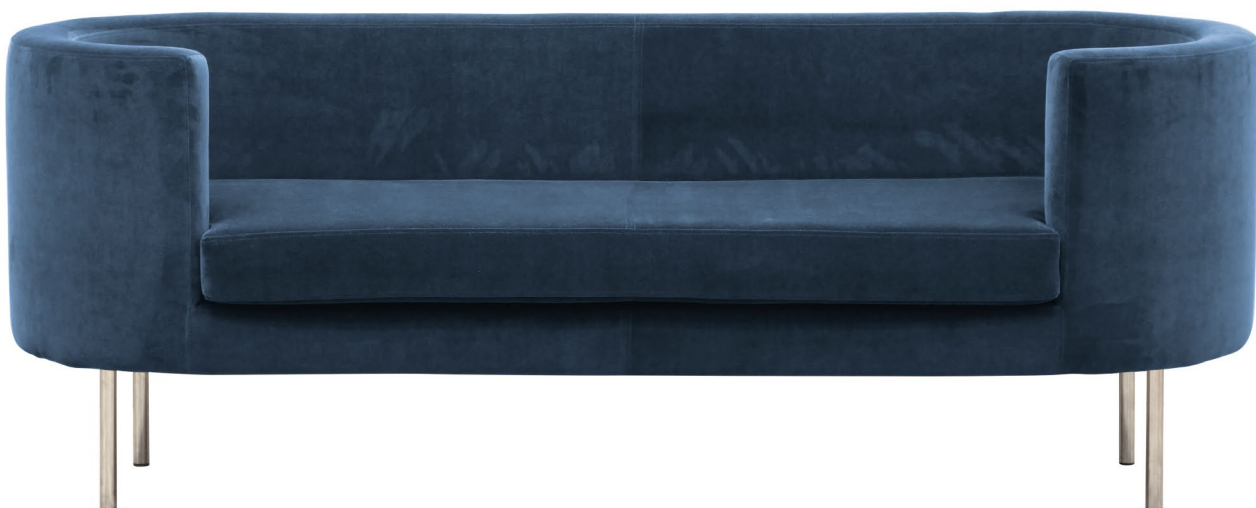
ROYAL 11204-46 BLUE