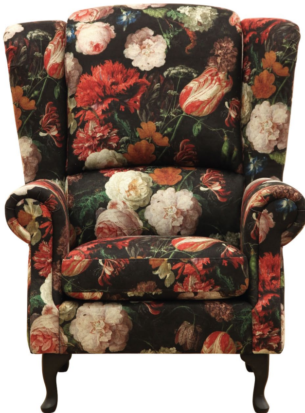
FLORA 14187-79 BLACK VELVET