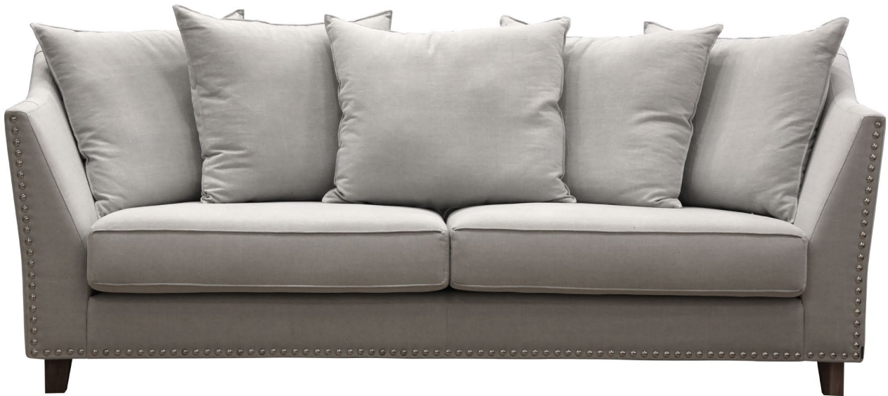
KISS 11006-71 ASHGREY